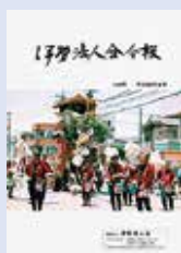
御園町新開 奉曳団