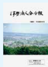
ロマンの森 伊勢三郷山