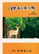
伊勢神宮 内宮 古殿地日本鹿