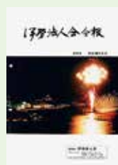
鳥羽 みなとまつり