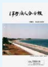
海亀が産卵に 訪れる北浜の海岸