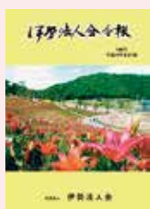
伊勢志摩 ゆりパーク