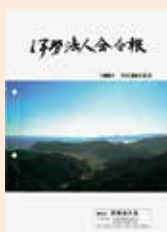
熊野古道 ツヅラト峠