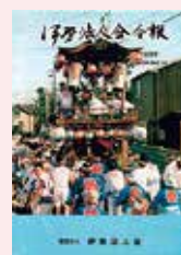
村松町 天王祭 (祇園祭り)